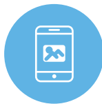
フローティング 広告