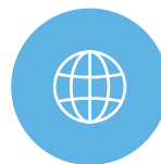
アプリ内ブラウザ