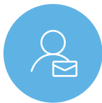
One to One コンテンツ