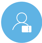
One to One クーポン