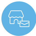
店舗別 コンテンツ配信