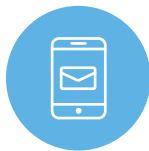
アプリ内メッセージ