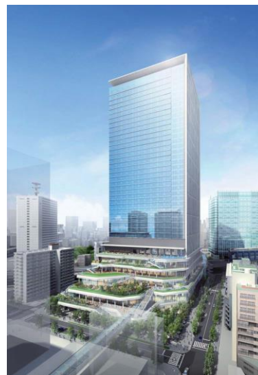
A街区（業務棟）外観イメージ

参考 URL : http://www.tokyu-land.co.jp/news/2016/000184.html