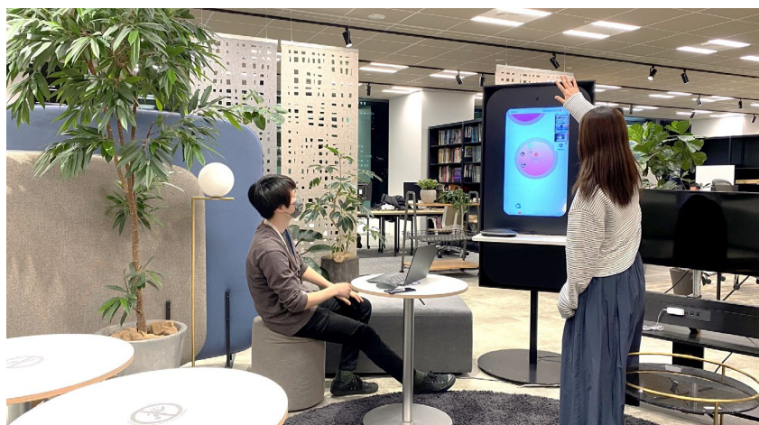
<オフィスからの参加イメージ>

今後、バーチャルオフィスとリアルなオフィスをシームレスにつなぐことで、離れた場所にいる社員同士のスムーズなコミュニケーションを実現し、快適な「働く環境」づくりに取り組んでいきます。