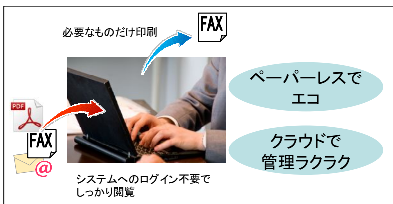
パソコンでの利用(オフィスでの利用)