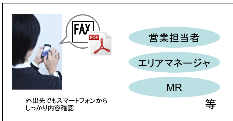
スマートフォンでの利用(外出先での利用)